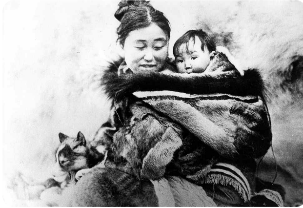
Nanook l'Esquimau , Robert Flaherty, Grands Films Classiques

« Plus que le goût de l'image cinématographique, c'est la trace profonde que le film laisse en nous qui s'avère décisive (...). La puissance de cette archive se manifeste autant dans sa capacité à imprimer les héritages (...) que dans les formes singulières de son écriture. »