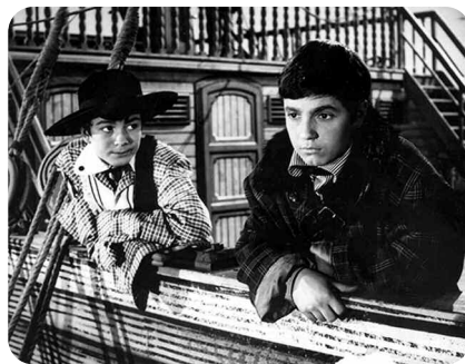
Le Dirigeable volé , Karel Zeman, Gebeka Films

Ukradená vzducholod , Italie/Tchécoslovaquie, 1966, 1 h 25, noir et blanc, couleur, version française, d'après Deux ans de vacances de Jules Verne, prise de vue réelle, décors en trompe-l'œil, animation de papier découpé, avec Michael Pospisil, Hanus Bor, Jan Cisek, production : Carlo Ponti Cinematografica/Filmové Studio Barrandov/Filmové Studio Gottwaldov, distribution : Gebeka Films