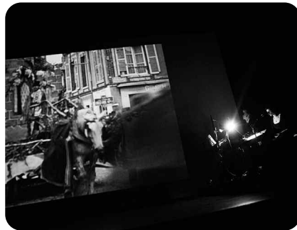
Cooper & Cooper

Avec le duo Cooper & Cooper (Cyril Solnais et Angélique Cormier, voix, claviers, platines, cuivres et une bonne dose d'humour).