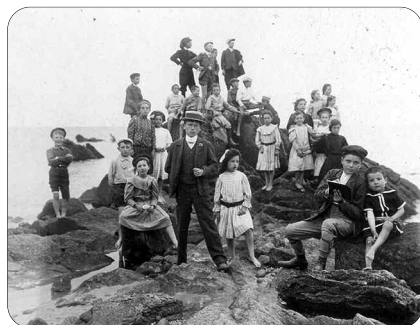
Œuvre des voyages scolaires et des colonies de vacances de Châteauroux, Émile Goué, Carnac, 1908

Exposition créée en partenariat avec les Archives Municipales de la ville de Châteauroux et avec le concours de Centre Images, réalisation : Jean-Louis Cirès, Archives Municipales et Emmanuelle Marcelot, cinéma Apollo.