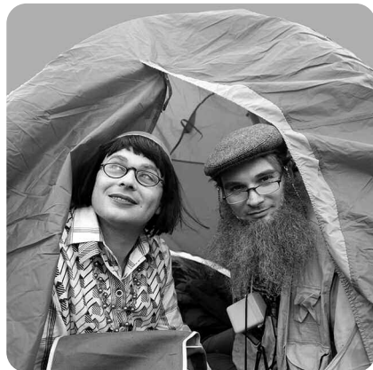
Conférences du monde , Cie Joseph K

Jeu: Stanislas Hilaiet et Jérôme Heuzé, vidéo: Jérôme Dupin, mise en scène: Gwen Aduh, production portée par la région Centre, coproductions: Cergy, Soit!, Nil Obstrat; aides à la création: ville de Paris, cirque Binet