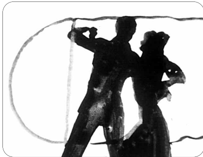
Reasons to be Glad , Jeffrey Scher