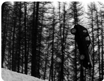
Prendre son envol , Amaury Brumauld, Les Films d'ici