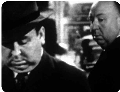
Double Take , Johan Grimonprez, Zapomatik