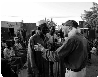
René Vautier dans Le Petit Blanc à la caméra rouge

Résistant dès l'adolescence, René Vautier quitte sa Bretagne natale pour apprendre le cinéma avec Louis Daquin à l'Idhec. Afrique 50 , son premier film, détourne une commande de la Ligue de l'enseignement et restera censuré 40 ans. Filmeur infatigable des injustices coloniales en Afrique du nord ( Avoir vingt ans dans les Aurès , 1971) et subsaharienne, Vautier fait de sa caméra une arme politique.