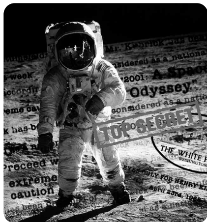
Opération Lune, William Karel, Point du jour/Arte