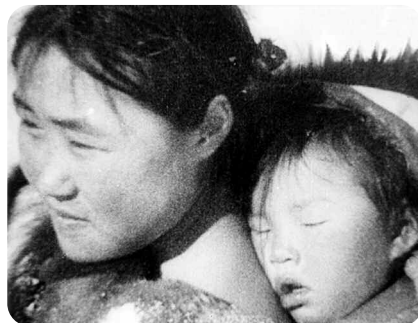
Nanouk l'Esquimau , Robert Flaherty, Grands Films Classiques

L'Américain Robert Flaherty (1884-1951) est considéré comme le père du cinéma documentaire depuis Nanouk l'Esquimau (1922). Ethnologue de formation, Flaherty allie réalisme et lyrisme, curiosité documentaire et goût de la mise en scène. « Tout art, disait-il, est une sorte d'exploration. Découvrir et révéler est la manière de travailler de tout artiste. Les explorateurs sont les transformateurs du monde. Ils découvrent pour nous une nouvelle image. »