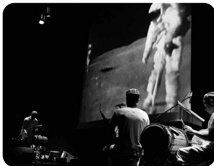
On a frappé sur la lune, DLDA Productions