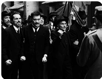
Vincere , Marco Bellocchio, Ad Vitam

Italie, 2009, 2 h 08, couleur, en version originale sous-titrée, avec Giovanna Mezzogiorno, Filippo Timi, Michela Cescon, production : Offside/Rai Cinema/Celluloid dreams, distribution : Ad Vitam