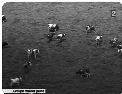
TDF06, Chant 1, Jean-Marc Chapoulie