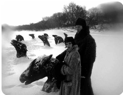
Winnipeg mon amour , Guy Maddin, ED Distribution

My Winnipeg , Canada, 2007, 1 h 19, noir et blanc, en version originale sous-titrée, avec Darcy Fehr, Ann Savage, production : Buffalo Gal Pictures/Documentary Channel/Everyday Pictures, distribution : E.D Distribution