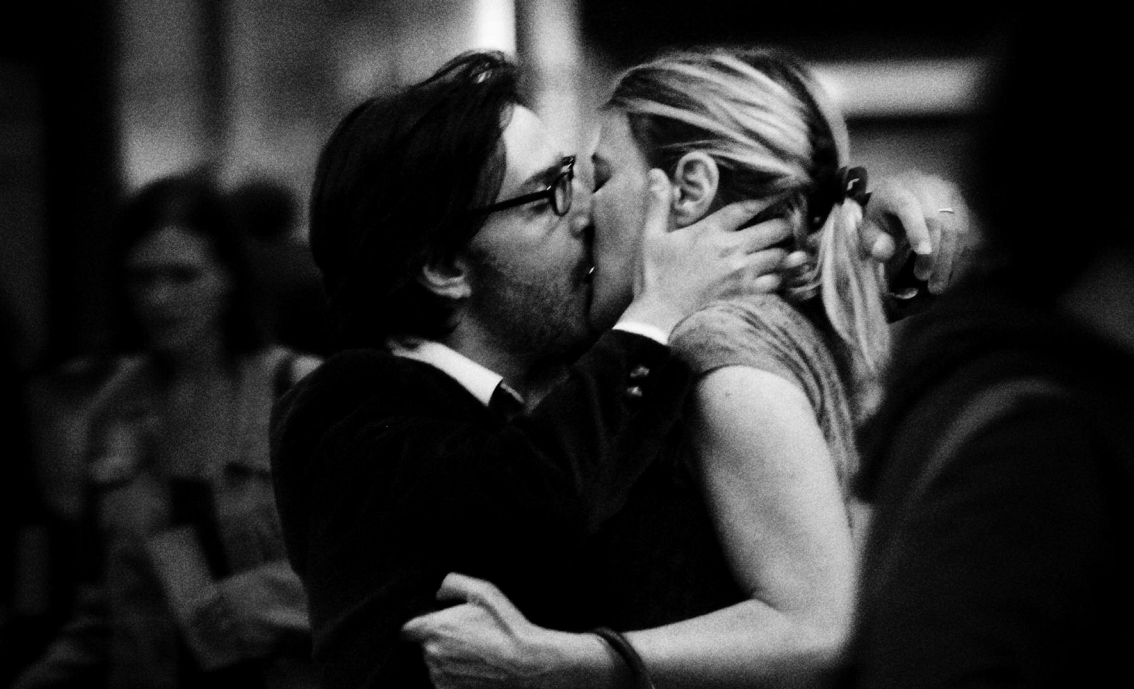
LES REGRETS de Cédric Kahn (Mars Distribution, 2009). Avec le soutien du Conseil régional d'Île-de-France et de la Région Centre.

Serge Steyer a dressé un rapide historique de l'audiovisuel breton, qui à l'instar d'autres régions, s'est fortement développé dans les années 90, mais dont l'élan a été coupé par les échecs successifs de la télévision numérique régionale (expérimentée à Rennes) et de Horizon 2004 (qui visait à doubler les décrochages locaux). Les professionnels ont, par ailleurs, subi l'effondrement des commandes de coproduction documentaire de France 3 Bretagne (de 40 à 15 documentaires par an en moyenne) et un durcissement au niveau national (resserrement du nombre de producteurs, suppression de la publicité).